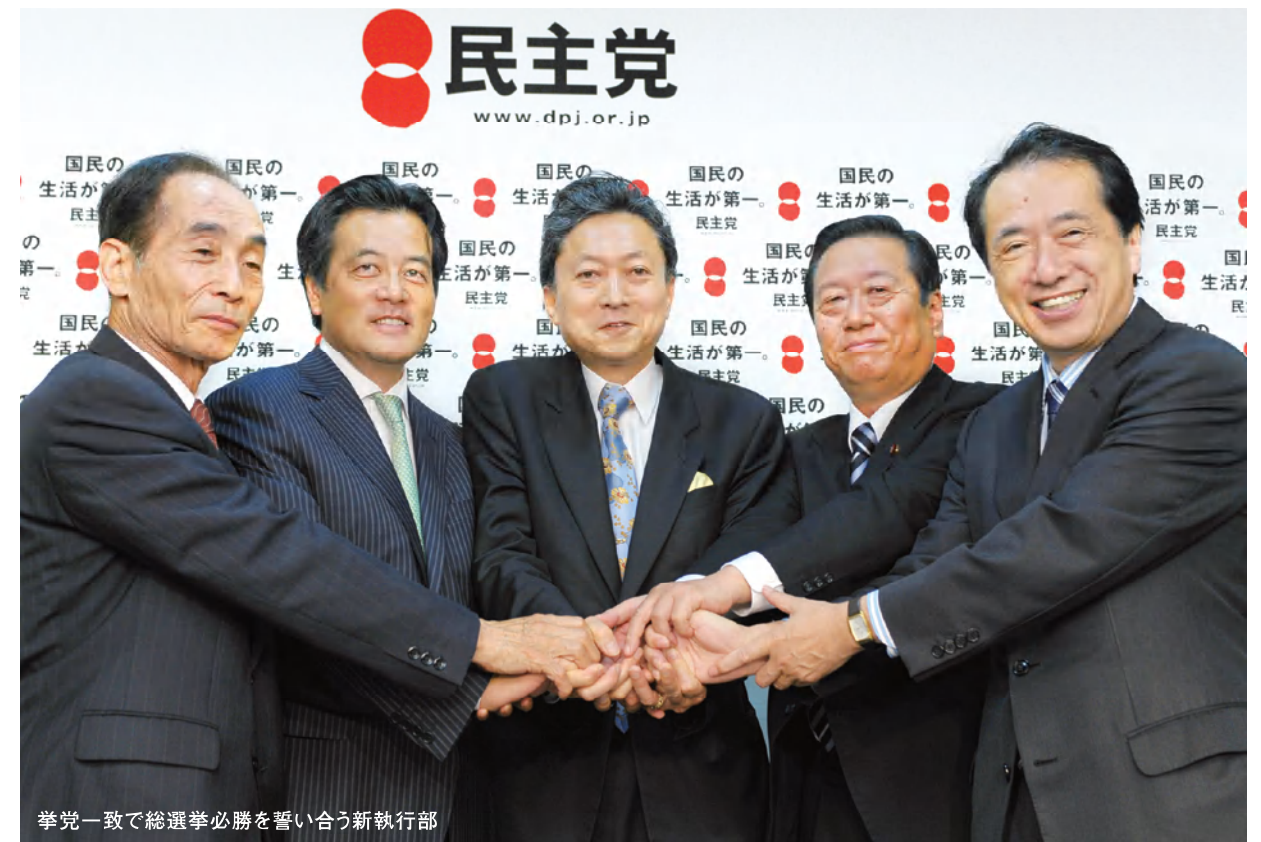
挙党一致で総選挙必勝を誓い合う新執行部

安定した雇用を増やします。これらの財源21兆円(2年間)は、税金のムダづかいを根絶し、予算の使い方を根本的に改めることで生み出します。税金を国民の手に取り戻し、国民本位の新しい仕組みをつくるのです。選挙目当てのばらまきであるうえ、2年後にも増税するという政府案とは正反対です。民主党は、政権交代の準備ができています。